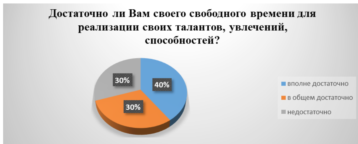
Рис. 6. Результаты ответа респондентов на вопрос «Достаточно ли Вам своего свободного времени для реализации своих талантов, увлечений, способностей?»

ских возможностей (рис.6). На вопрос «Как Вы оцениваете развитость досуга в работе учреждения?» ответы распределились следующим образом: «отлично» - 10%, «хорошо» -60%, «удовлетворительно» - 20% респондентов (рис. 7).