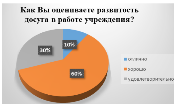
Рис. 7. Результаты ответа респондентов на вопрос «Как Вы оцениваете развитость досуга в работе учреждения?»