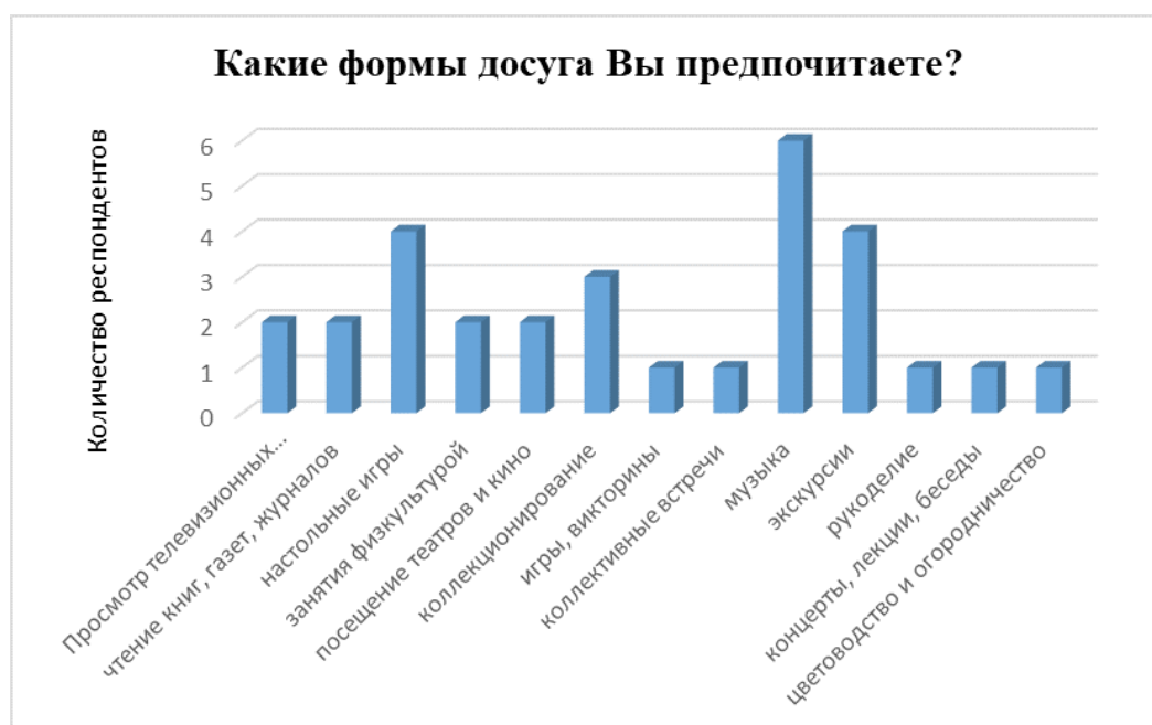
Рис. 3. Результаты ответа респондентов на вопрос «Каковы формы досуга Вы предпочитаете?»

проявляют интерес 30% пожилых респондентов; просмотр телевизионных передач выбрали 20% опрошенных, столько же респондентов (20%) выбрали чтение книг, газет и журналов. Согласно полученным данным меньший интерес у респондентов вызывают игры и викторины (10%), коллективные встречи (10%), рукоделие (10%), концерты и беседы (10%), цветоводство и огородничество (10%) (рис.3).