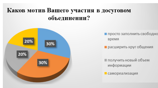
Рис. 5. Результаты ответа респондентов на вопрос «Каковы мотивы Вашего участия в досуговом объединении?»

На вопрос «Каковы мотивы Вашего участия в досуговом объединении?» получены следующие ответы: простое заполнение времени (30%) и расширение круга общения (30%). Получение новой информации предпочитают 20% опрошенных, столько же - самореализацию (рис.5).