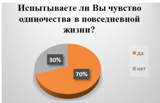
Рис. 1. Результаты ответа респондентов на вопрос «Испытываете ли Вы чувство одиночества в повседневной жизни?»

пожилых людей в возрасте от 60 лет до 81 года, 40% из которых имеют родственников, но живут отдельно; 20% живут с родственниками, а 40% опрошенных респондентов – одиночки. Методом сбора информации было индивидуальное анкетирование.