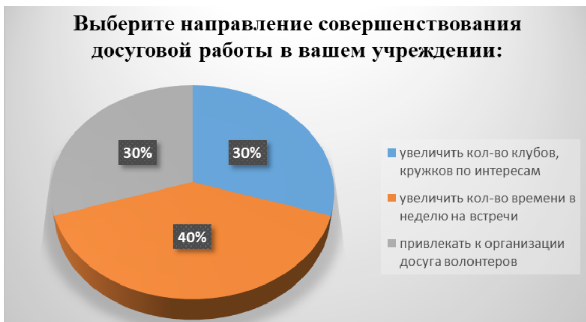
Рис. 9. Результаты ответа респондентов на утверждение «Выберите направление совершенствования досуговой работы в вашем учреждении»

Таким образом, результаты исследования показали, что у большинства пожилых людей, принявших участие в опросе, существует потребность их участия в досуговых мероприятиях в КЦСОН г. Брянска с целью уменьшения чувства одиночества