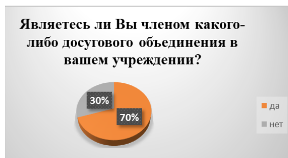
Рис. 4. Результаты ответов респондентов на вопрос «Являетесь ли Вы членом какого-либо досугового объединения в Вашем учреждении?»

Большинство (70%) респондентов на вопрос «Являетесь ли Вы членом какого-либо досугового объединения в Вашем учреждении?» ответили утвердительно, что позволяет предположить о наличии в учреждении, на базе которого мы проводили исследование, положительной тенденции в применении адаптивных досуговых технологий и интеграции пожилых людей в общество. Между тем, 30% опрошенных не принимают участия ни в каких досуговых объединениях (рис.4).