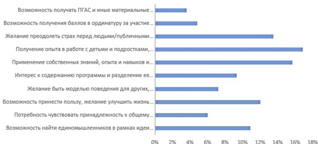
Рис. 1. Мотивы, являющиеся ключевыми (1-ое место) в волонтерской деятельности студентов

В опроснике о мотивации к волонтерской деятельности в рамках проекта большинство опрошенных (16,8%) на первое по значимости место поставили получение опыта в работе с детьми и подростками, возможность положительно повлиять на их развитие; 15,7% – применение собственных знаний, опыта и навыков и получение новых знаний в профессиональной деятельности, что соотносится с полученными выше данными. 13,3% – желание преодолеть страх перед людьми/публичными выступлениями через участие в добровольчестве (рис.1)