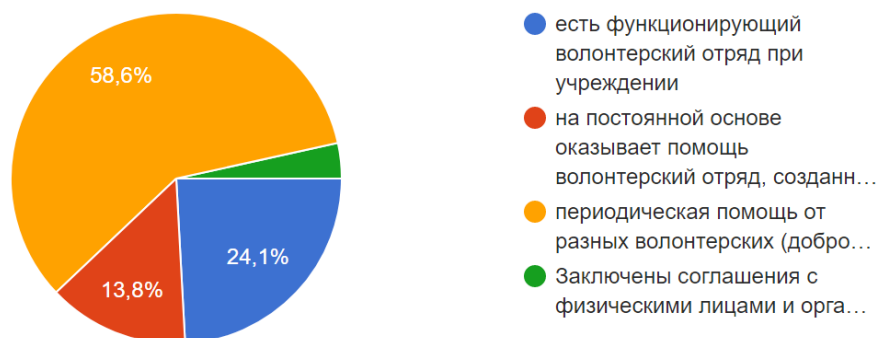
Рис. 2. Характеристика взаимодействия учреждений социального обслуживания Курской области с волонтерскими (добровольческими) организациями